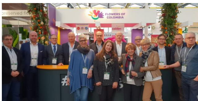
Commercianti della filiera florovivaistica ligure a IFTF (Olanda)