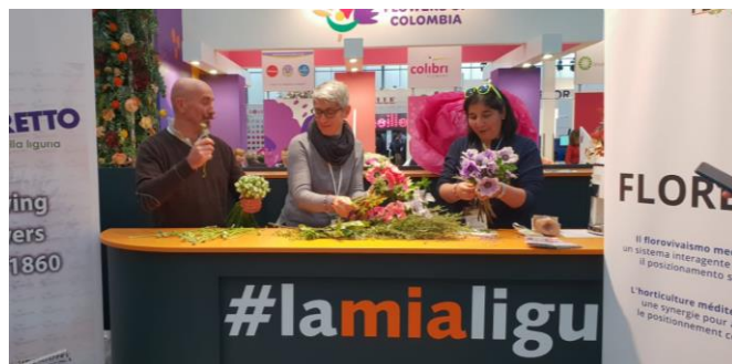
Lo Stand collettivo di Regione Liguria e Distretto Florovivaistico della Liguria alla fiera IFTF (Olanda) con dimostrazione di decorazione floreale a cura del Progetto Flore 3.0