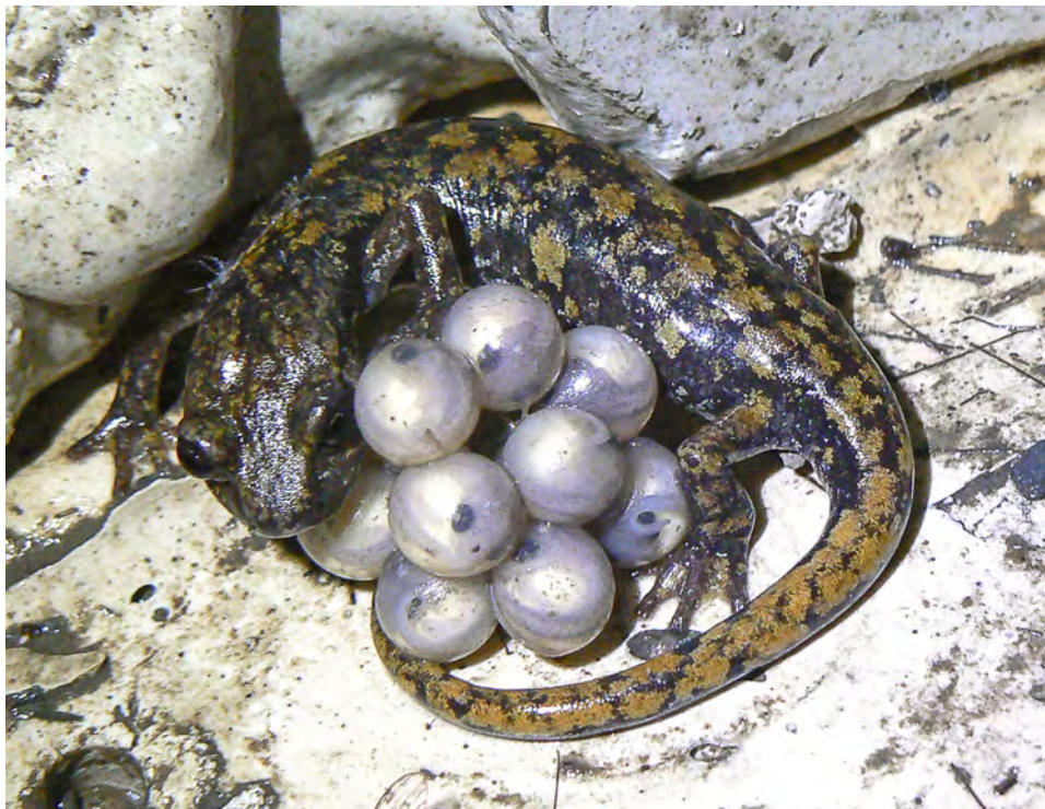
La femmina del Geotritone protegge le uova e i piccoli fino a 40 giorni dopo la schiusa.

possono manifestarsi mutazioni o malattie che causano la nascita di individui malformati, e l'esistenza di serpenti a due teste, può aver sostenuto in passato certe leggende. Ben nota e diffusa in tutta Italia ed in Liguria è la credenza che i serpenti siano attratti dal latte.