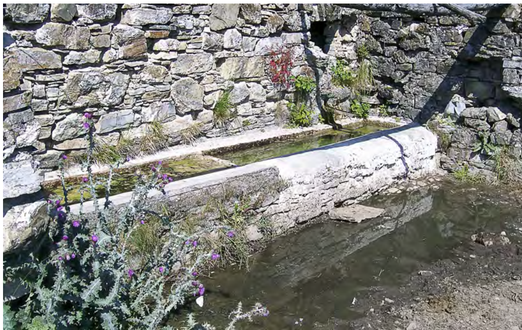
Abbeveratoio ad Alpe di Vobbia. I vecchi lavatoi ed abbeveratoi rappresentano un possibile habitat per molte specie di anfibi.