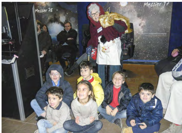
Casa del Romano (Fascia), 6 gennaio: all'Osservatorio Parco Antola Befane tra le stelle, visite guidate tematiche per la giornata dell'Epifania, dolcetti ai molti bimbi presenti.