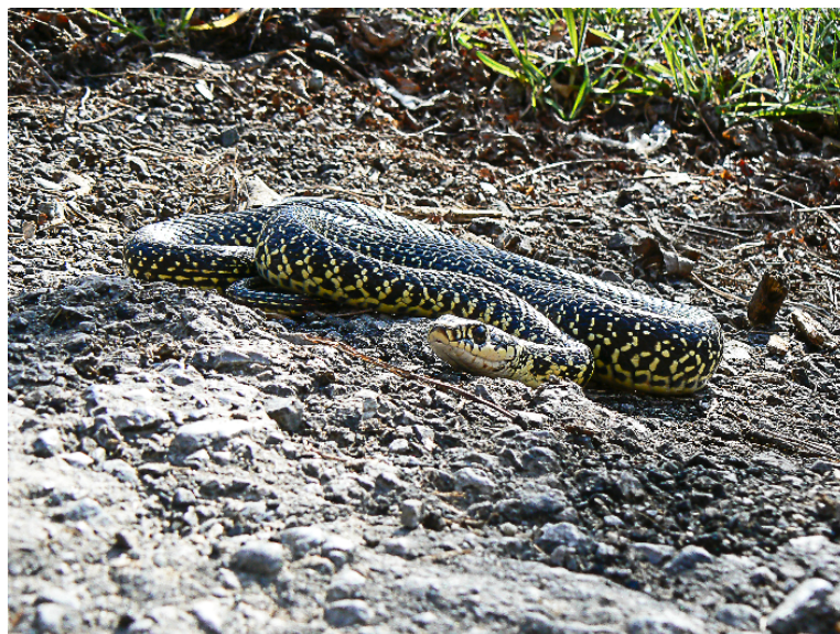
Esemplare di Biacco

Una curiosità: il geotritone è l'unico Anfibi italiano che ha delle vere cure parentali, cioè la madre difende attivamente da estranei le uova per circa 10 mesi, spesso senza mangiare per tutto il periodo e, una volta schiuse, resta ancora per 40 giorni circa vicina ai neonati difendendoli anche con la forza da aggressori. Infine è utile ricordare una specie che