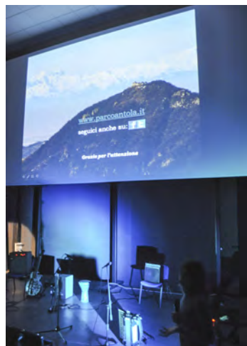
Ronco Scrivia, 31 gennaio: gli interventi del Parco Antola alla "Sera Vallescrivia", organizzata dalla Proloco di Ronco Scrivia.