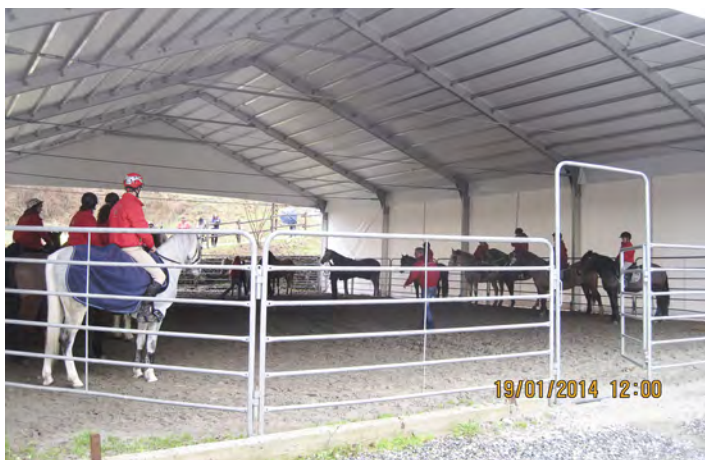
Torriglia, 19 gennaio: Inaugurazione del Maneggio coperto al Centro di Turismo Equestre Mulino del Lupo.