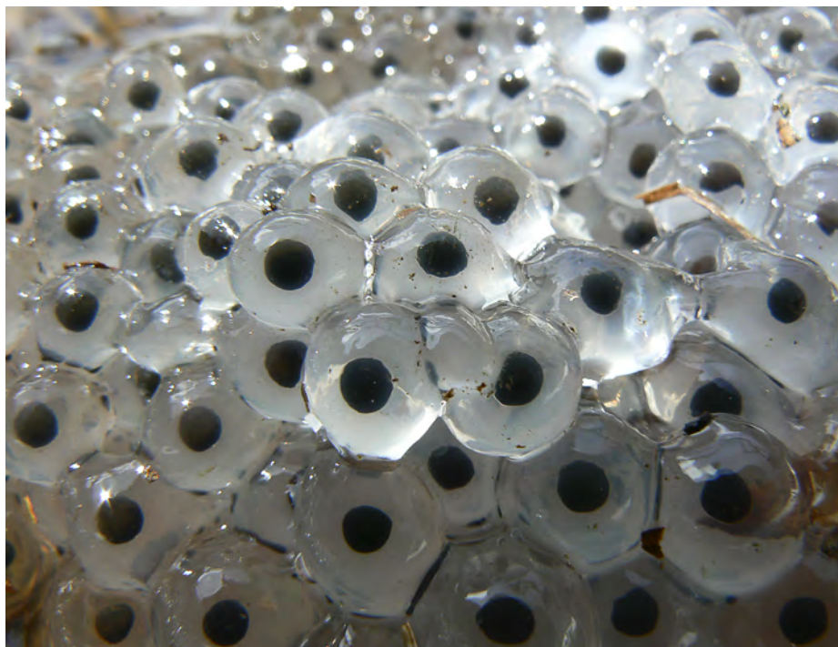
Ovatura di Rana

Ad onor del vero occorre ricordare che in natura anche negli animali