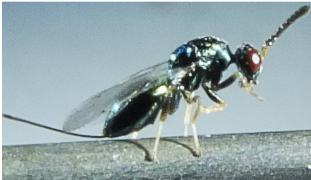
Femmina di Torymus sinensis ottenuta da allevamento presso il Servizio Fitosanitario della Regione Liguria

biologica centrato sulla diffusione dell'imenottero parassitoide Torymus sinensis (fam. Torimidi).