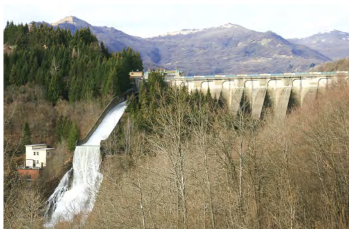
Diga del Brugneto, 21 gennaio: A seguito delle prolungate ed abbondanti piogge di quest'inverno, l'acqua in eccesso nel lago viene rilasciata a valle dallo scarico della diga creando una spettacolare cascata.