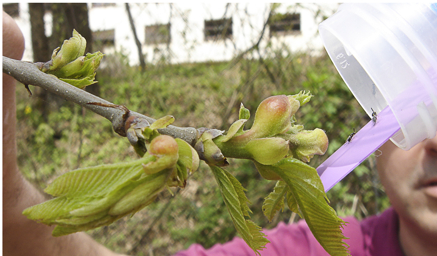
Rilascio di Torymus sinensis su galle provocate da Dryocosmus kuriphilus .

Sono stati sensibilizzati gli enti presenti nel terri-