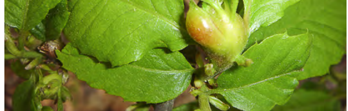
Galla provocata da Dryocosmus kuriphilus e Torymus sinensis appena rilasciato.

Sulla base di esperienze giapponesi e coreane, nel 2003 è stato avviato un progetto di lotta