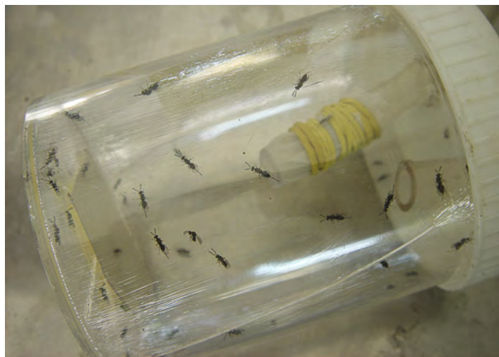
4 Decine di individui di Torymus sinensis ottenuti nei laboratori dell'Istituto Regionale per la Floricoltura

I dati divulgati dalla Regione Piemonte sulla situazione dei propri castagneti (primi rilasci del torimide a livello nazionale nel 2005) dimostrano che si sta raggiungendo un equilibrio naturale tra il cinipide e il suo antagonista. Il Piemonte è la prima regione italiana a raggiungere tale risultato.