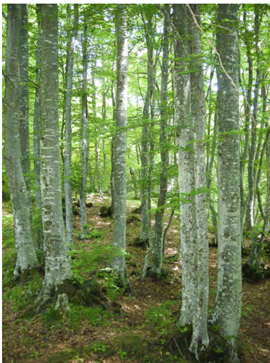
Ceduo di faggio fortemente invecchiato tendente all'alto fusto

Inizialmente sono stati effettuati sopralluoghi in Parco in modo da poter individuare le principali tipologie di boschi presenti, all'interno delle quali sono state delimitate aree di saggio, rappresentative del bosco circostante. In queste aree sono state ricavate informazioni inerenti le specie erbacee ed arboree presenti (volume, numero di fusti). Sulla base della massa legnosa ricavata, del tipo di soprassuolo