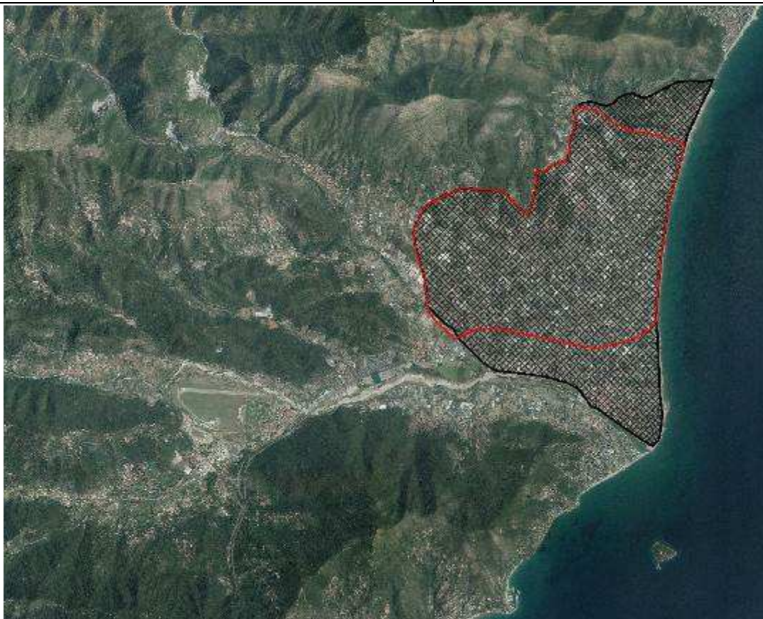
Figura 1: il perimetro rosso indica la Zona Vulnerabile ai nitrati di cui alla DGR 1256/2004, la retinatura nera indica il perimetro del corpo idrico sotterraneo CI_ASV01_B

Come si evince dalla figura 1 il perimetro della ZVN albenganese (perimetro rosso) risulta interamente compresa nel corpo idrico sotterraneo (perimetro e retinatura nera): il lieve sconfinamento lungo il confine sudoccidentale rappresenta un particolare grafico privo di significato idrogeologico e risulta pertanto opportuno correggere in tal senso la geometria della ZVN.