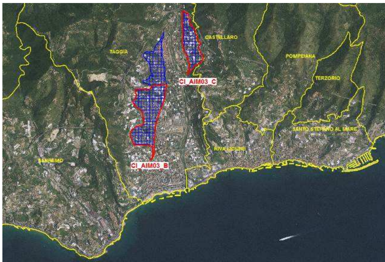
Figura 4. Rappresentazione cartografica (perimetro rosso) delle aree di acquifero critiche per la presenza di nitrati, corrispondenti con il corpo idrico sotterraneo CI_AIM03_C e con la parte meridionale del corpo idrico sotterraneo CI_AIM03_B (retinatura blu).

Per l'area ZVN di Albenga e Ceriale il trend dei valori di nitrati riscontrati nei pozzi oggetto di monitoraggio mostra un andamento in leggero calo, ma pur sempre superiore al limite massimo di 50 mg/l imposto dalla normativa, Si evidenzia, pertanto, la necessità di mantenere la designazione dell'area e l'applicazione del Programma di Azione che è necessario aggiornare per il sessennio di riferimento dell'ultimo Piano di Tutela delle Acque approvato (2016-2021). Tale Programma di Azione deve essere seguito e rispettato sia nell'area ZVN già designata di Albenga e Ceriale, che nella nuova area ZVN del bacino del torrente Argentina.