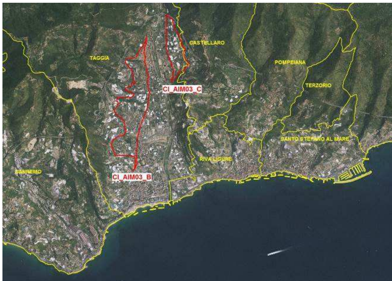
Figura 3. Rappresentazione cartografica (perimetro rosso) dei corpi idrici sotterranei CI_AIM03_B e CI_AIM03_C, presso l'acquifero del torrente Argentina (tratta dal Piano di Tutela delle Acque di cui alla DCR 11/2016); la parte centrale dell'acquifero è costituita dal corpo idrico CI_AIM03_A che non presenta criticità significative per la concentrazione di nitrati.

Per quanto riguarda l'acquifero del torrente Argentina il Piano di Tutela delle Acque ha già portato ad una perimetrazione dei corpi idrici sotterranei, su base idrogeologica, mirata a delimitare con maggiore precisione la criticità legata ai nitrati, come mostrato nella figura 3.