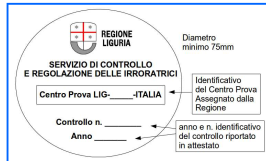
Esempio di etichetta adesiva