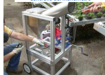
Misurazione portata lancia

Una volta superato il controllo funzionale il Centro Prova rilascia: