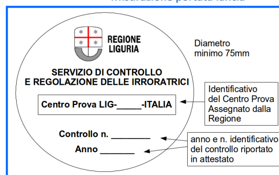
Esempio di etichetta adesiva

Una volta superato il controllo funzionale il Centro Prova rilascia: