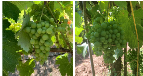
Vermentino a Finale a sx e Lumassina a Quiliano a dx

Nuovo strumento di modellistica (fenologia della vite e altri indicatori utili) al link https://tinyurl.com/CAARmodelli La scala fenologica BBCH vite http://bit.ly/BBCH_Vite2019