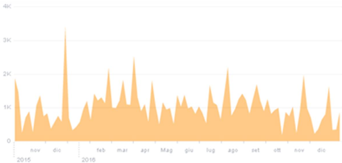
Capitolo 4. Figura 4 - Copertura social