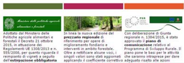
Figura n. 6 - Agriliguria News

Il 29 dicembre doppio appuntamento con il PSR 2014-2020 PSR Tour: martedì prossimo, l'assessore regionale all'Agricoltura Stefano Mai sarà ad Imperia e alla Spezia per presentare i bandi e illustrare le potenzialità del Programma di Sviluppo Rurale. In mattinata è infatti previsto un incontro presso la sede della Camera di Commercio di Imperia, mentre nel pomeriggio, sarà la volta della Camera di Commercio della Spezia. (approfondisci su Agriliguria.net)