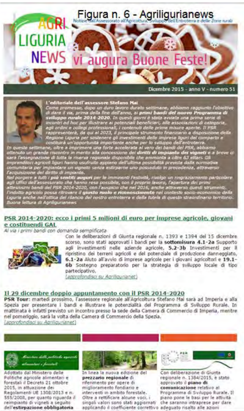
Figura n. 6