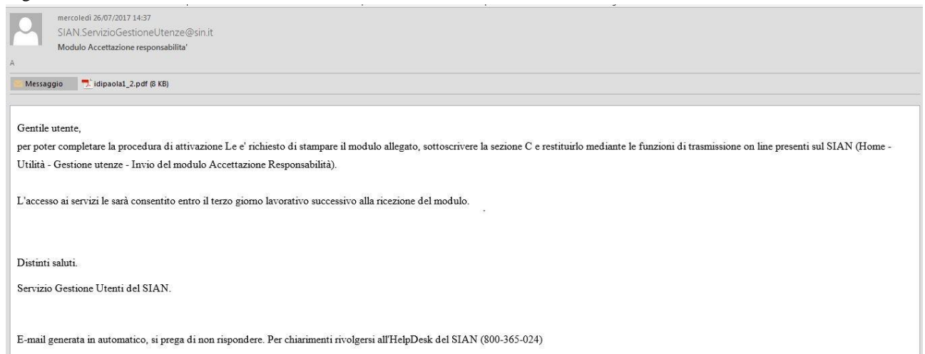
Figura n.5 - Testo email con modulo di accettazione

In caso di problemi nell'esecuzione della procedura di attivazione può contattare il numero verde del SIAN 800-365024 .