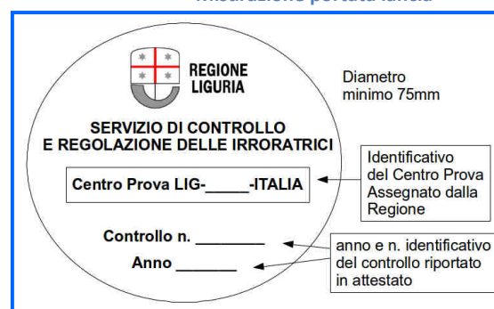
Esempio di etichetta adesiva

Una volta superato il controllo funzionale il Centro Prova rilascia: